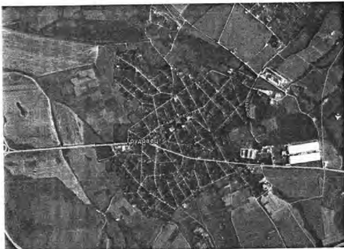
Фигура 3: Урбанизирана територия на село Трудовец

Подготвена е статистика в табличен вид за големината на урбанизираните територии на селата, които ще бъдат проучени.