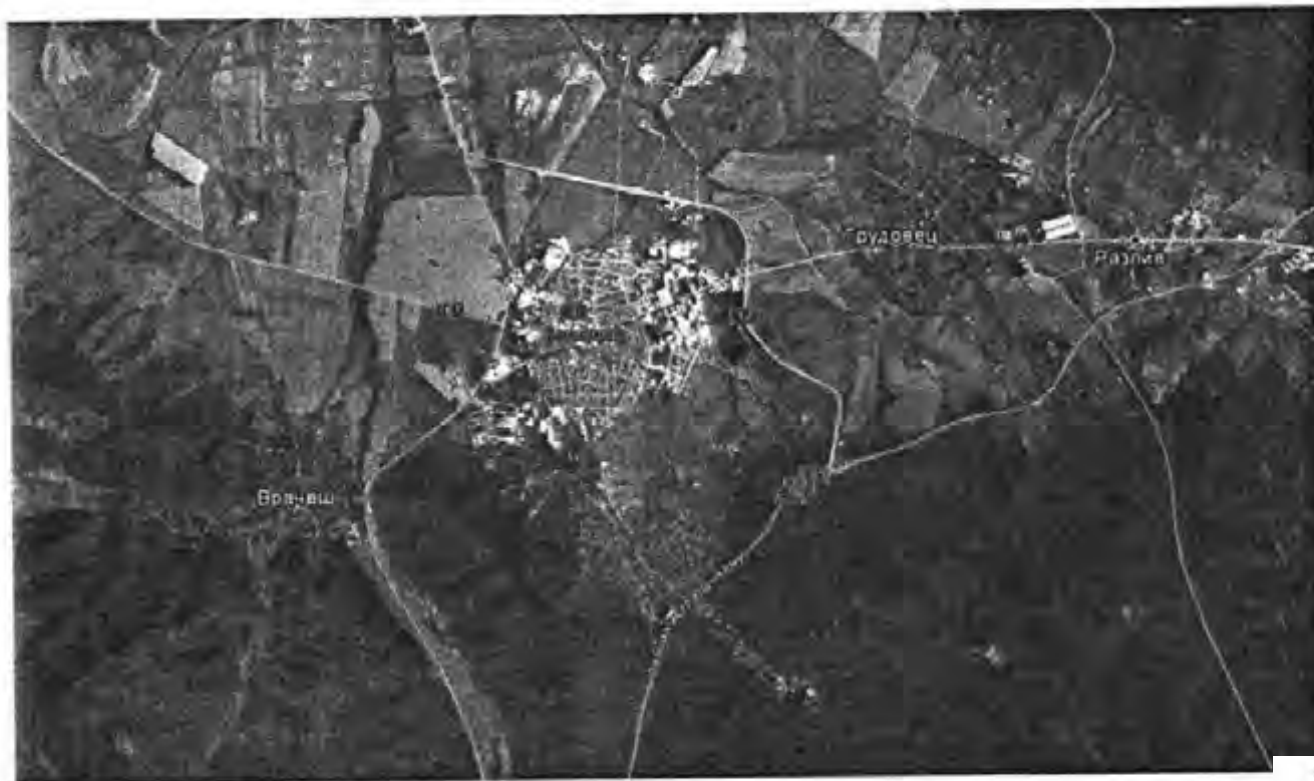
Фигура 1: Населени места, предмет на обособената позиция