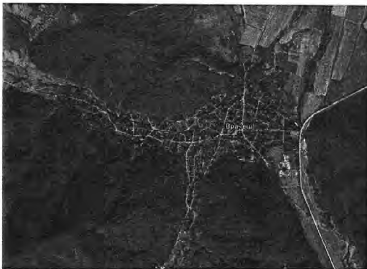
Фигура 2: Урбанизирана територия на село Врачеш

СГКК-София област съвместно с общинска администрация Ботевград предоставят карти, планове и друга документация за с. Врачеш и с. Трудовец, община Ботевград, област София, по реда на чл. 30 от "НАРЕДБА № РД-02-20-5 от 15 декември 2016г. за съдържанието, създаването и поддържането на кадастралната карта и кадастралните регистри", в сила от 13.01.2017г., Обн. ДВ. бр.4 от 13 Януари 2017г., Изм и Доп. ДВ бр. 25 от 20 март 2018г.". АГКК предоставя на изпълнителя съответните данни.